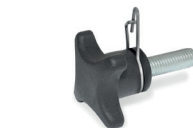
GN 6335.4 → Seite 553 GN 6335.5 → Seite 553 Form ST