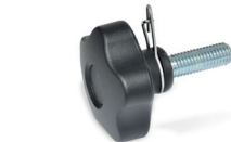
GN 5337.2 → Seite 533 Gr. 32 ... 63