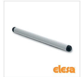
ELESA original design MSR.60-T13