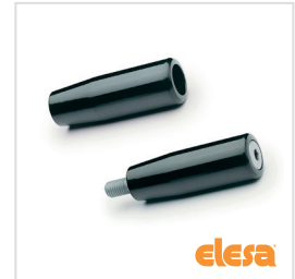
ELESA original design I.281/I.281+x-SST