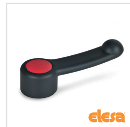
ELESA original design ELC./ELC.SST