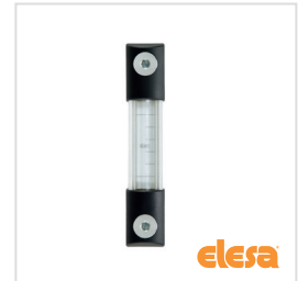
ELESA original design HCK./HCK-GL