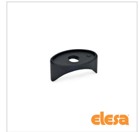
ELESA original design ADT