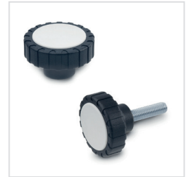
Rändelgriff ohne Gewindeeinsatz