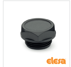
ELESA Original design TN.