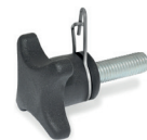
GN 6335.4 → Seite 587 GN 6335.5 → Seite 587 Form ST