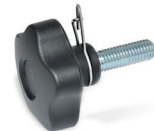
GN 5337.2 → Seite 561 GN 5337.7 → Seite QVX Gr. 32 ... 63