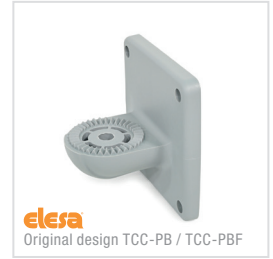
elesa Original design TCC-PB / TCC-PBF