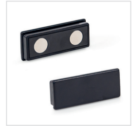
Ansicht auf Haftfläche