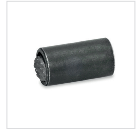
Anwendungsbeispiel verschiedener Pendelelemente mit O-Ring