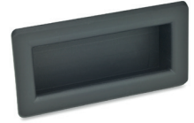
elesa Original design ERB-PF